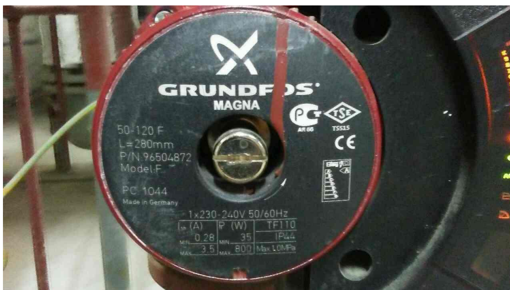
Zdjęcie 1. Tabliczka znamionowa pompy działającej